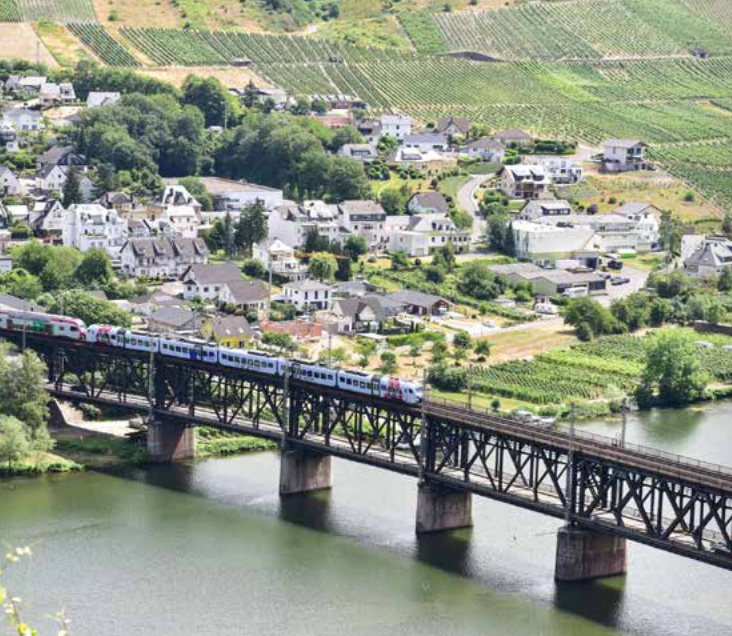
Blick auf Bullay mit der Doppelstockbrücke für Bahn und Straße

Entdecker-Tipp: Auf Ihrer Fahrt von Bullay über Zell an der Mosel bis nach Kirchberg sollten Sie den Collis-Turm nicht verpassen. Von hier aus haben Sie eine atemberaubende Aussicht über die Moselschleife. In Kappel haben Sie Anschluss an den Hunsrück-Mosel-Radweg, der Sie bis nach Treis-Karden führt. Weitere Infos unter www.zellerland.de sowie unter www.visitmosel.de