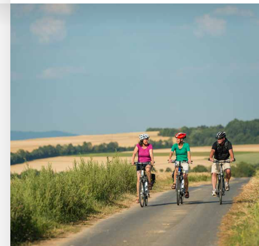
Weitblick genießen auf dem Maifeld-Radweg

Entdecker-Tipp: Der RadBus Eifel-Ardennen bringt Sie nach Gerolstein, von wo Sie Ihre Tour Richtung Belgien starten können. Zwischen Prüm und St. Vith ist der Bahntrassen-Radweg besonders gut ausgebaut. Hinter Pronsfeld erreichen Sie das naturnahe Tal des Alfaches. In St. Vith treffen Sie auf den Venn-Radweg mit dem nördlichen Ziel Aachen und dem südlichen Ziel Clervaux. Weitere Infos unter www.eifel.info