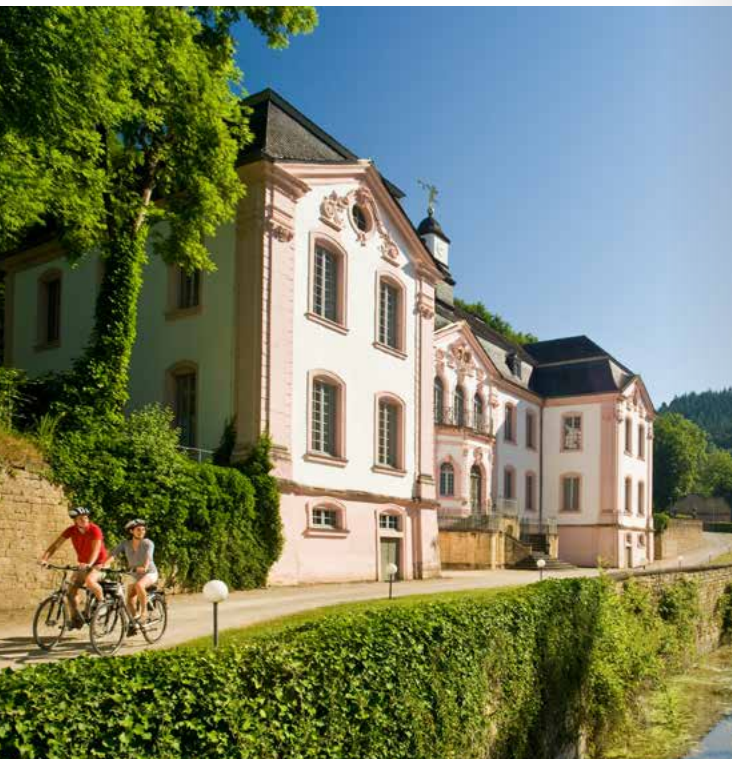
Schloss Weiterbach in Bollendorf am Sauer-Radweg

Entdecker-Tipp: Der RadBus Oberes Saueratal bringt Sie nach Biesdorf auf die Höhen über dem Gaybach. In einer langen Talfahrt gelangen Sie nach Wallenborn zum Sauer-Radweg, von wo aus Sie ganz bequem flussabwärts Richtung Mosel fahren können. Weitere Infos zum Sauer-Radweg unter www.eifel.info/a-sauer-radweg