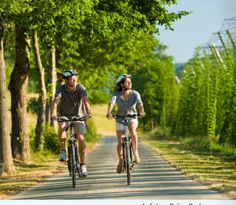
Auf dem Prüm-Radweg

Radstrecke und lassen Sie die RadBusse die Anfahrt übernehmen. Da sind zum Beispiel die Anstiege in der Eifel, im Hunsrück oder im Westerwald, die ungeübten Radfahrer einiges abverlangen. RadBus-Haltestellen entlang der Mosel, Ruwer, Sauer, Ahr und Nette garantieren ebenfalls, dass Sie jederzeit Ihren Ausflug beenden können, ohne „auf der Strecke“ zu bleiben.