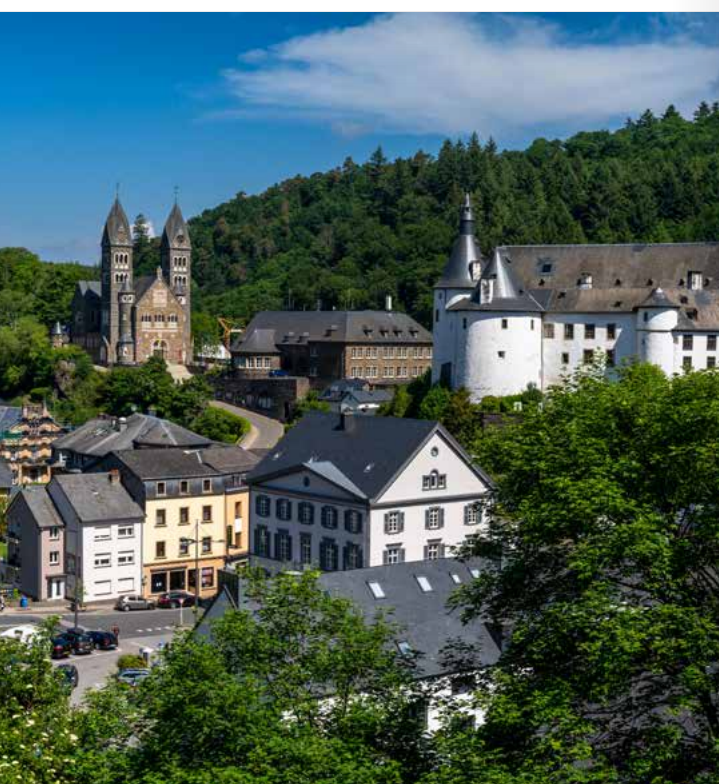
Blick auf die Altstadt und das Schloss in Clervaux (Luxemburg)