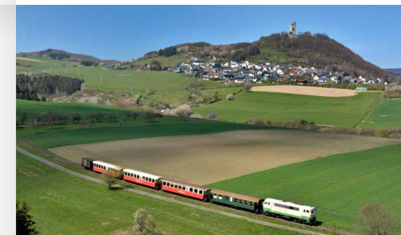
Vulkan-Expres rollt talwärts vor der Burg Olbrück

Entdecker-Tipp: Der RadBus Oberes Ahrtal bringt Sie zum Ausgangspunkt des Ahr-Radweges und zur Ahrquelle nach Blankenheim. Von dort aus können Sie zurück bis nach Ahrbrück radeln. Weitere Infos unter www.ahrтал.de