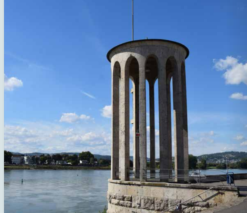
Pegelturm in Neuwied am Rhein

* Relevante Ferien & Feiertage in Rheinland-Pfalz: Osterferien 25.03.–02.04., Ostermontag 01.04., Tag der Arbeit 01.05., Chr. Himmelfahrt 09.05., Pfingstmontag 20.05., Pfingstferien 21.05.–29.05., Fronleichnam 30.05., Sommerferien 15.07.–23.08., Tag der Deutschen Einheit 03.10., Herbstferien 14.10.–25.10., Allerheiligen 01.11.