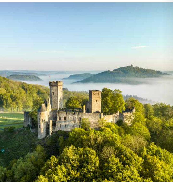
Die Kasselburg in Pelm bei Gerolstein