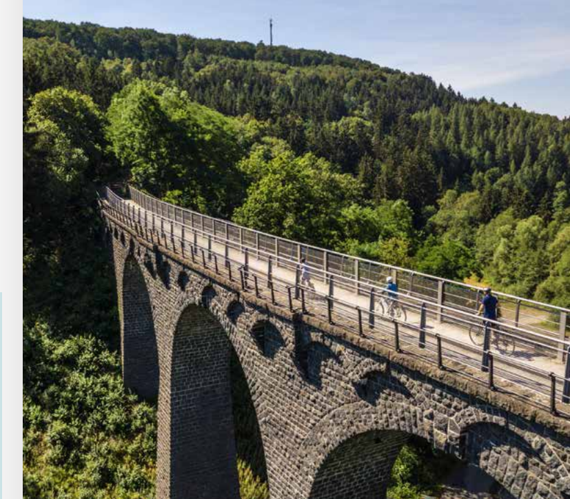
Auf dem Maare-Mosel-Radweg bei Daun

Entdecker-Tipp: Erkunden Sie die Vulkaneifel und das Moseltal auf dem Maare-Mosel-Radweg. Der RadBus Maare-Mosel-Express bringt Sie flott von Bernkastel-Kues nach Daun oder zurück. Weitere Infos zum Maare-Mosel-Radweg unter www.maare-moselradweg.de