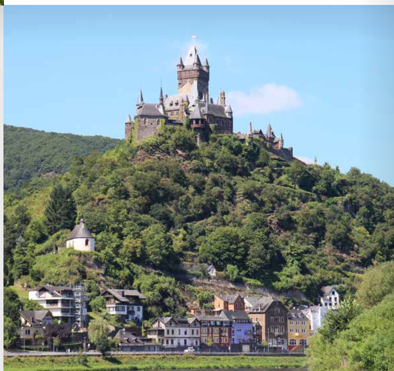
Reichsburg in Cochem

Entdecker-Tipp: Zwischen Simmern, Kastellaun und Emmelshausen schlängelt sich der Schinderhannes-Radweg durch den wunderschönen Hunsrück. Der RadBus Schinderhannesland bindet Kirchberg an Simmern und Kastellaun an. Weitere Infos unter www.hunsruicktouristik.de