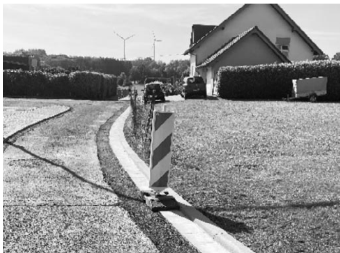
Zum Ebertswald, Schwarzenbach