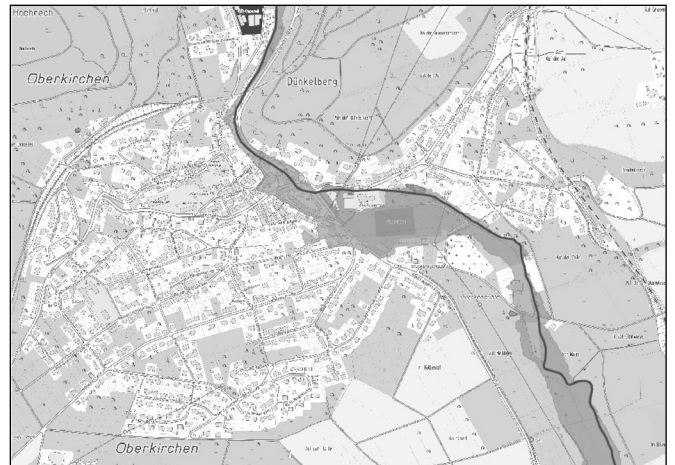
Ausschnitt der Überschwemmungsgebietskarte der Oster

Auf der Basis der Hochwassergefahrenkarten setzen die Bundesländer Überschwemmungsgebiete amtlich fest. Im Saarland wird die Ausdehnung der Überschwemmungsgebiete aus den Gefahrenkarten für das Szenario HQ100 (ein Hochwasser, das statistisch einmal in 100 Jahren auftreten kann) in den Karten der Wasserbehörde dargestellt. Diese Karten werden anschließend in den jeweiligen Kommunen ausgelegt, d.h. Kommunen und Bürgern wird die Möglichkeit der Einsicht- und Stellungnahme gegeben. Nach der Auswertung der Stellungnahmen gelten mit der Bekanntmachung der Verbindlichkeit im Amtsblatt des Saarlandes die in den Karten der Wasserbehörde dargestellten Gebiete als festgesetzte Überschwemmungsgebiete.