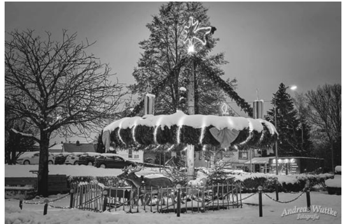
Die Adventkranzparty wird jährlich vom Adventkranzteam veranstaltet.

Am Freitag, 25. November, findet bereits zum 22. Mal die Adventkranzparty vor der Parkschenke Simon in Nonnweiler statt. Ab 18:00 Uhr können Besucher nicht nur den sechs Meter breiten Adventkranz bestaunen, sondern sich bei Speis und Trank und gemütlicher Musik auch in Weihnachtsstimmung bringen. Für die kleinen Besucher kommt sogar der Nikolaus vorbei!