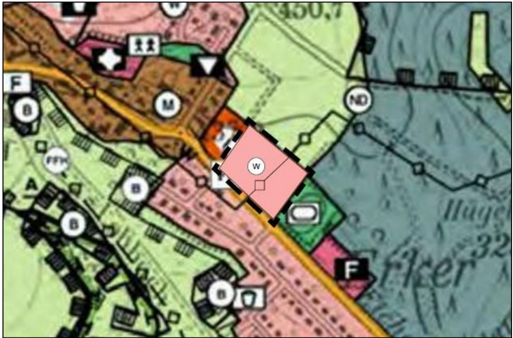
Abb.: Ausschnitt aus dem FNP der Gemeinde Nonnweiler mit der geplanten Änderung, ohne Maßstab, genordet