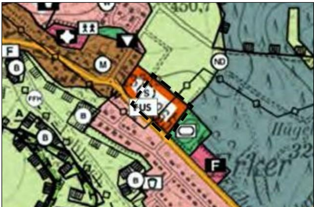
Abb.: Ausschnitt aus dem FNP der Gemeinde Nonnweiler vor der geplanten Änderung, ohne Maßstab, genordet

Gem. § 8 Abs. 2 BauGB sind Bebauungspläne aus dem Flächennutzungsplan zu entwickeln. Der Flächennutzungsplan der Gemeinde Nonnweiler stellt für den Geltungsbereich eine geplante Sonderbaufläche mit der Zweckbestimmung „Ausbildungszentrum Jugendfußball“ sowie eine unterirdische Leitung dar. Um dem Entwicklungsgebot nachzukommen, wird der Flächennutzungsplan im Parallelverfahren gem. § 8 Abs. 3 BauGB geändert. Die Fläche soll fortan als „Wohnbaufläche“ dargestellt werden.