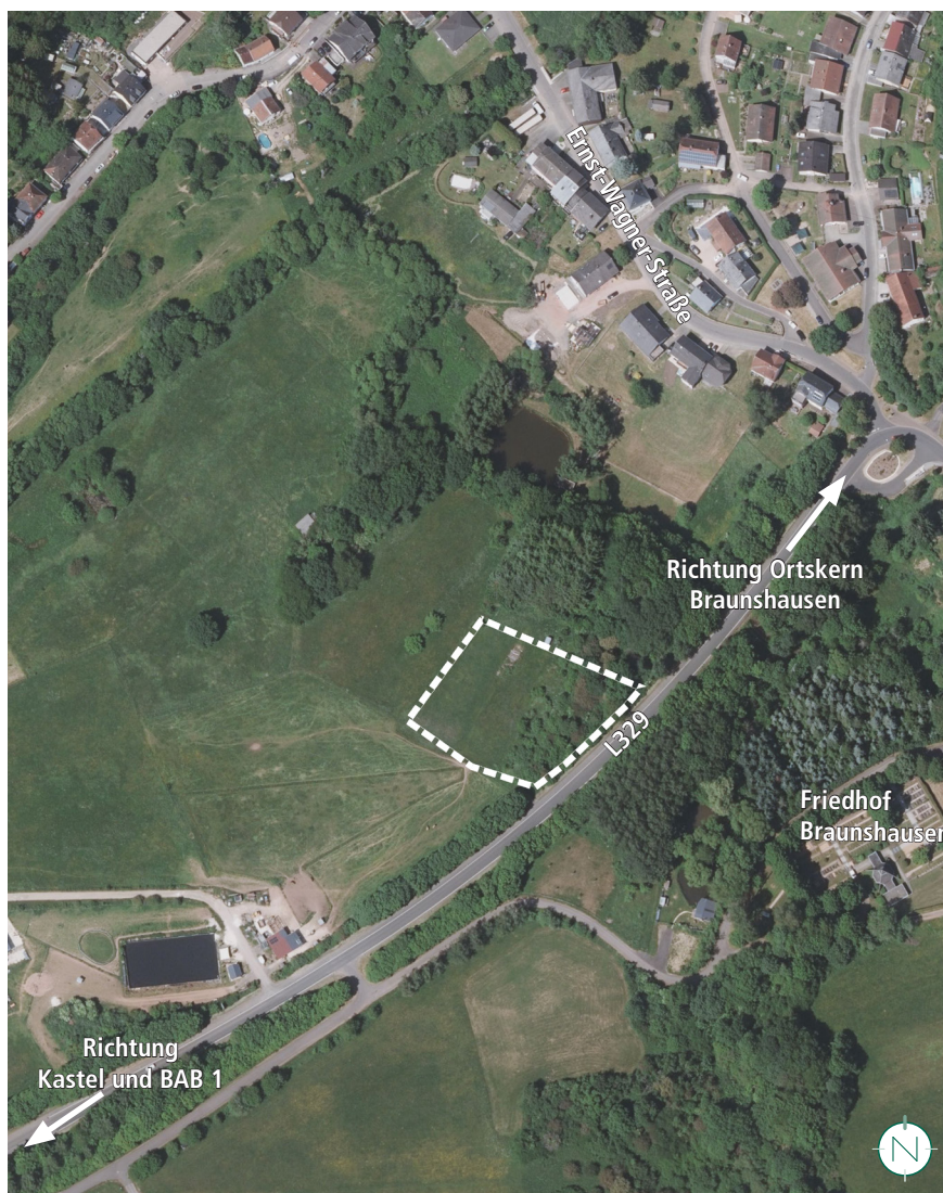
Luftbild mit Geltungsbereich; ohne Maßstab; Quelle: LVGL; Bearbeitung: Kernplan

Parallel zur Teiländerung des Flächennutzungsplanes wird eine Umweltprüfung nach § 2 Abs. 4 BAuGB durchgeführt. Der Umweltbericht ist gesonderter Bestandteil der Begründung (der Umweltbericht entspricht dem Planwerk zum Bebauungsplan „Neubau Feuerwehrgerätehaus Braunshausen“).