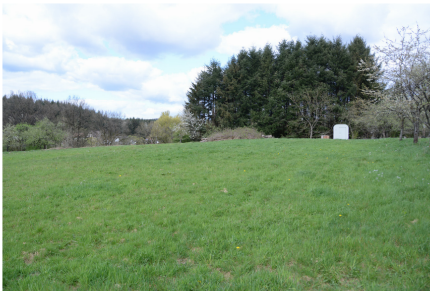
Blick von Süden auf das südliche Plangebiet (mit bestehenden Gehölzstrukturen)

Es gibt ferner keine naheliegenden Flächen die sich für eine entsprechende Nutzung, unter Berücksichtigung der Ausrückzeiten, anbieten würden. Weitere mögliche Standorte im Außenbereich, die nicht der Land- oder Forstwirtschaft zugehörig sind, sind aufgrund von naturschutzfachlichen Restriktionen ausgeschlossen. Zudem spielen die Eigentumsverhältnisse hier eine wichtige Rolle, da dies eine zeitnahe Umsetzung gewährleistet. Sollte diese Option nicht verfolgt werden, wäre die vorgesehene Planung in der Gemeinde in dieser Form nicht umsetzbar.