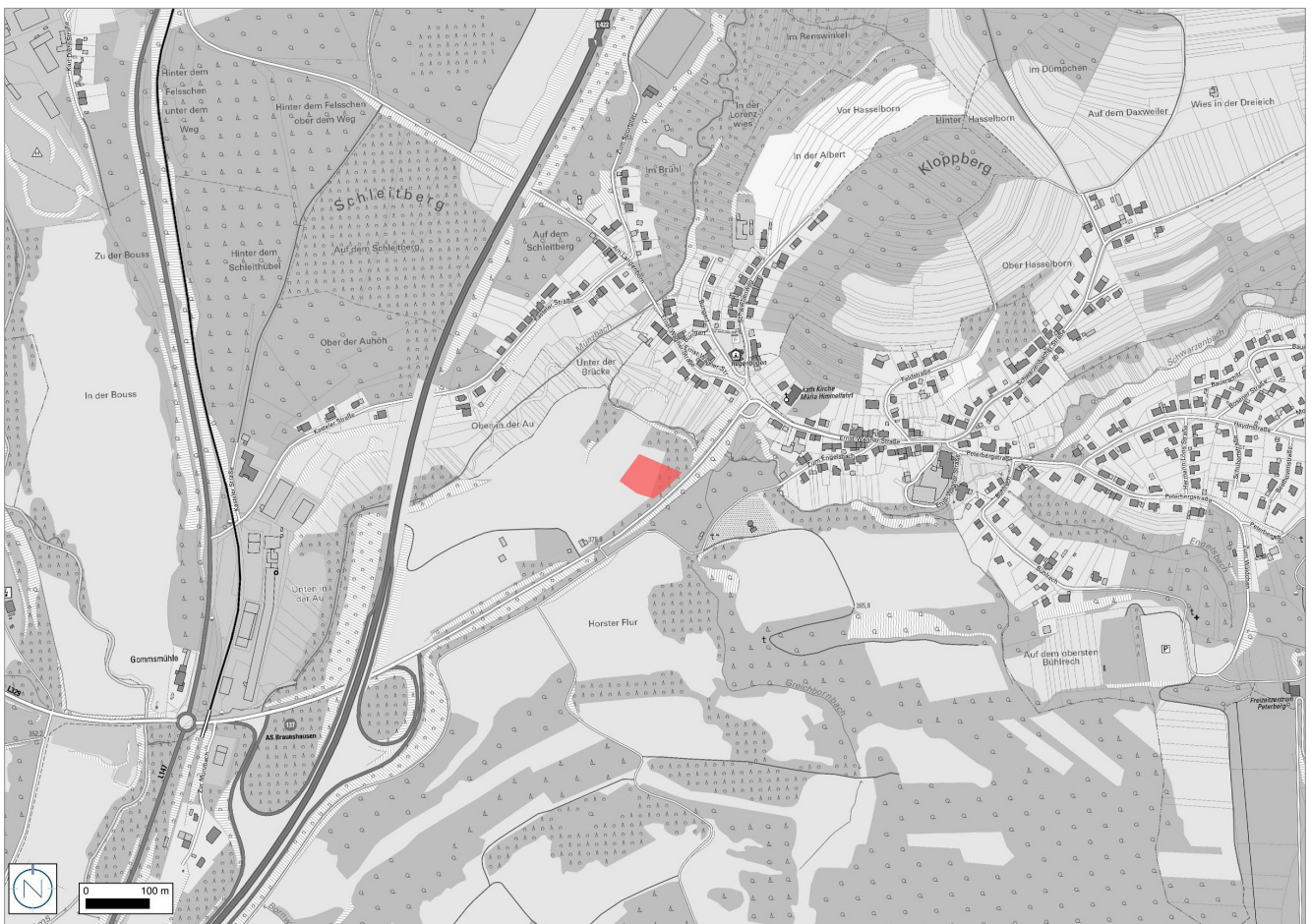
Übersichtsplan mit Geltungsbereich (rot); ohne Maßstab Quelle: LVGL; Bearbeitung: Kernplan

Mit der zukünftigen Ansiedlung der Feuerwehr am vorgesehenen Standort geht eine räumliche Definition des empfohlenen 'Eintrittsradius' (i. S. d. Planungs- und AusstattungsVV) einher. Demnach können mit dem neuen Standort mehrere Ortsteile durch einen innerhalb von 8 Minuten erreichbaren