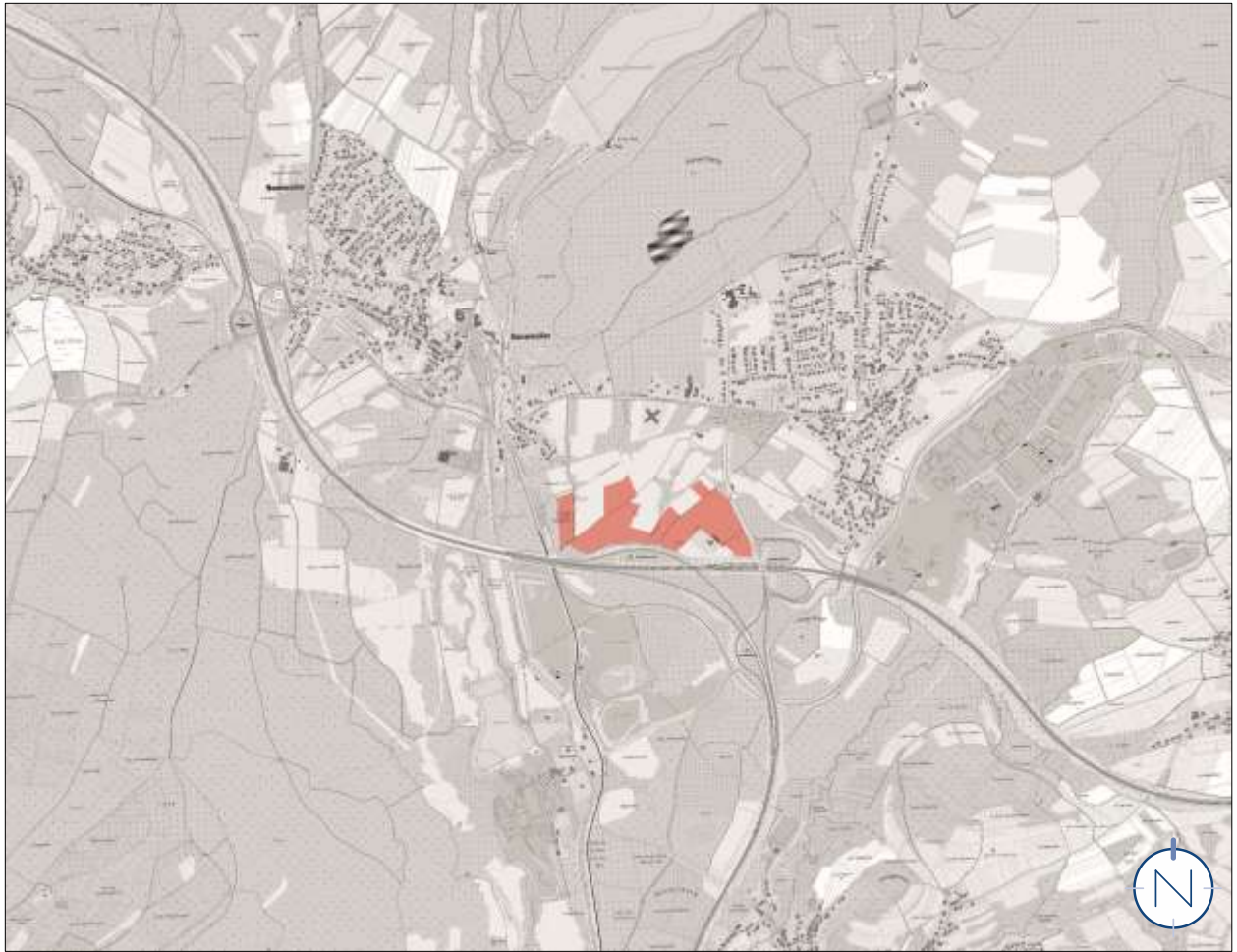
Stand: 27.05.2025