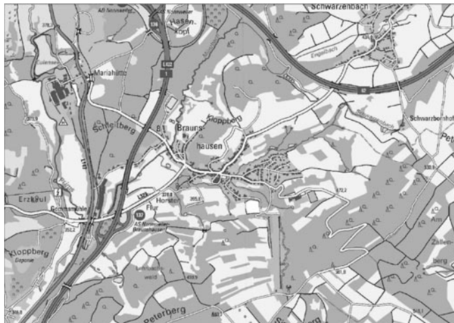
Quelle: ZORA, Z - 026/05, LVGL; ohne Maßstab; Bearbeitung: Kernplan

Die genaue Abgrenzung ergibt sich aus dem folgenden Lageplan.